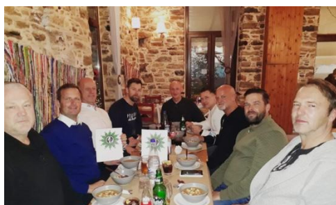
Weihnachtessen auf Samos