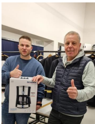
Kaffeemaschine Service Büro