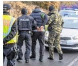
Deutsch-polnische Streife im Einsatz in Pomellen

„Stationäre Grenzkontrollen hätten vor allem Staus zur